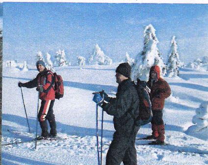
Fra Maskat.